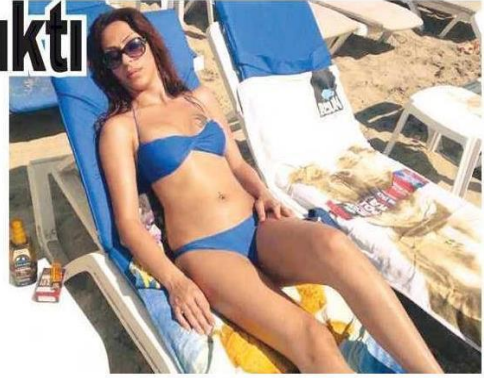
Figür 9: Şok, 12 Temmuz 2013

tespit edilen S.Ö.'nün öldürdüğü iddia edilen Dora Özer takma adlı H.U.Ö.'nün cep telefonu, dizüstü bilgisayarını, çantası gibi şahsi eşyalarını da evinde buldu. Yapılan ilk sorgulamada suçunu itiraf eden S.Ö.'nün eve müşteri olarak gittiklerini, ilişkiye girdikten sonra ücret konusunda anlaşamadıkları için tartıştıklarını ve öldürdüğünü söylediği öğrenildi. (İHA)