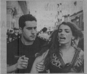
Figür 29: Günlük Evrensel, 20 Ağustos 2016

■ Siyasi söylemlerde cinsiyetçi ifadeler cezalandırılmalı.