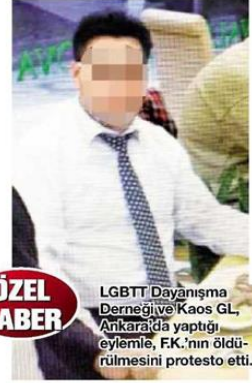
LGBTT Dayanışma Derneği'ne Kaos GL, Ankara'da yaptığı eylemle, F.K.'nin öldürülmesini protesto etti.

Araştırmada F.K.'nin gündüz başka, gece bambaşka bir hayat sürdüğü ortaya çıktı. 35 yaşındaki F.K.'nin 3 yıl önce evlendiği ve 1 çocuk sahibi olduğu, ailesine ve yakın çevresine ise gece bir işadınının özel şoförlüğünü yaptığını söylediği öğrenildi. Evden ayrıldıktan sonra çantasına koyduğu kadın kıyafetlerini giyen, makyaj yapan, peruk takan F.K.'nin, Avcılar'da yol kenarında müşteri beklediği anlaşıldı.