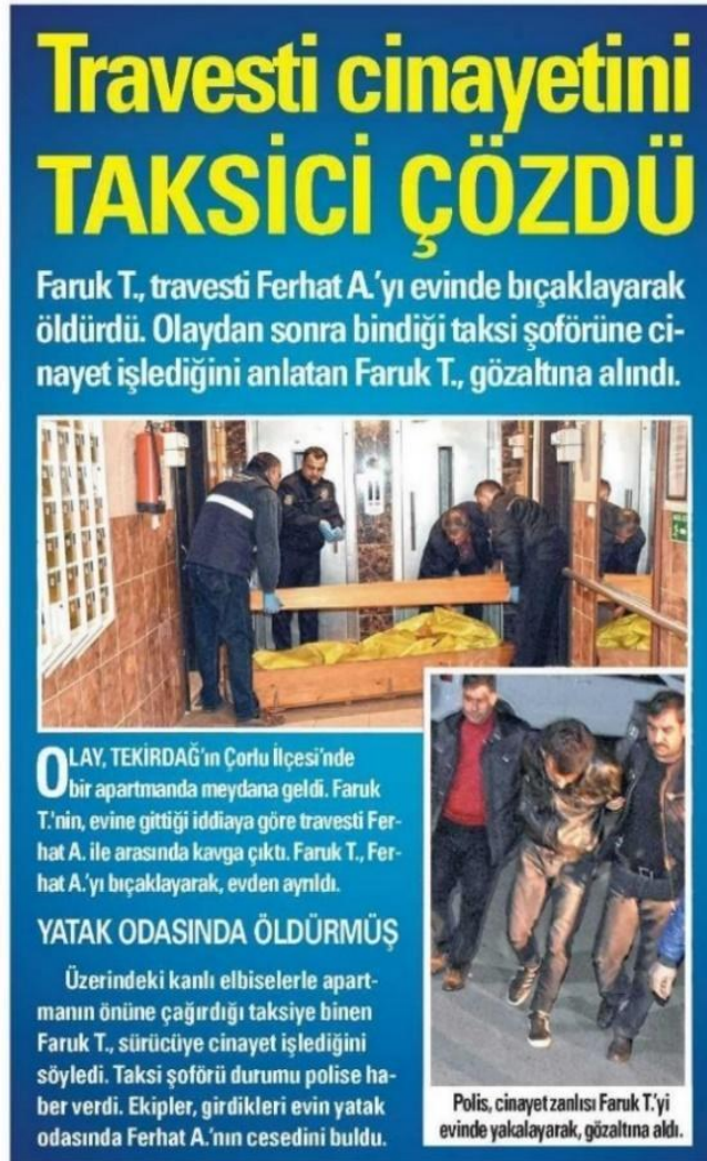
Figür 10: Akşam, 21 Mart 2016

Örneğin, Şok gazetesinde Dora cinayetini konu alan haberin başlığında yer alan "Dora'nın katili müşterisi çıktı" ifadesiyle maktulün seks işçisi olmasına vurgu yapılıyor ve trans seks işçileri için cinayetin beklendik bir son olduğu ima ediliyor. Ayrıca, "S.Ö.'nün eve müşteri olarak gittiklerini ilişkiye girdikten sonra ücret konusunda anlaşamadıkları için tartıştıklarını ve öldürdüğünü söylediği öğrenildi" ifadeleriyle cinayet, basit bir pazarlık meselesine indirgeniyor ve cinayet muğlak ifadelerle bir sır perdesi olarak gizemli bir tonla okuyucuya servis ediliyor.