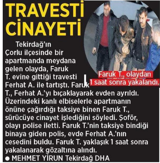
Figür 13: Milliyet, 21 Mart 2016

Haberlerin yapısı ve çerçevesi kadar haberlerde kullanılan sözcükler de heteronormatif toplumsal cinsiyet rejiminin bakış açısını yansıtıyor. Haberde kullanılan sözcükler ve ifadeler belli çağrışımlarla okuyucuyu yönlendiriyor. Örneğin, taradığımız haberlerin neredeyse tamamında translar toplumsal algıda olumsuz çağrışımları olan 'travesti' kelimesiyle tanımlanıyor.