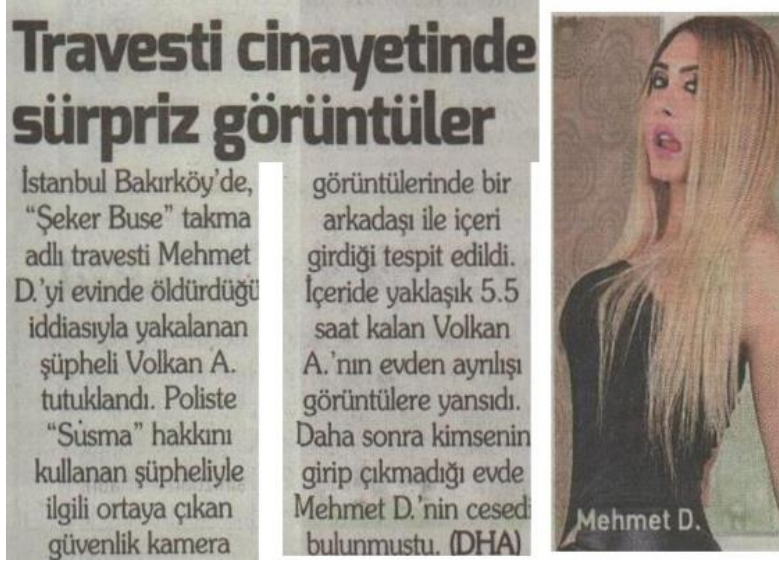
Figür 12: Korkusuz, 11 Mart 2016